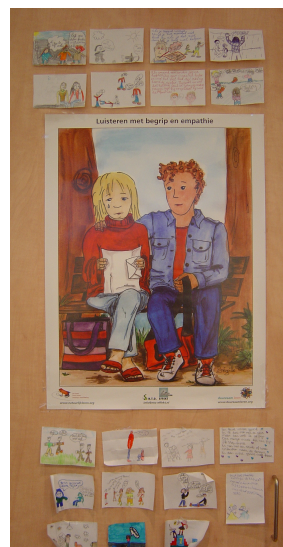
De denkgewoonte 'luisteren met begrip en empathie' met visualisering van kinderen om het gedrag concreet te maken.

In dit hoofdstuk wordt vooral het denken achter het boek beschreven. In het kort worden de onderliggende kaders en concepten toegelicht. In de volgende hoofdstukken wordt een aspect van de theorie met behulp van praktijkvoorbeelden beschreven. Hierin wordt concreet gemaakt hoe het brein optimaal geactiveerd kan worden. Het machinedenken is een belangrijke denkkader voor de vormgeving van het onderwijs het in de afgelopen decennia. De huidige vernieuwing komt onder andere voort uit het denken vanuit een levend systeem. Daarbij wordt meer gedacht vanuit mogelijkheden dan vanuit problemen. De Lerende organisatie is een belangrijke ondersteunend kader zoals Peter Senge dit beschreven heeft in zijn vijfde disciplineboek "Lerende Scholen". De concretisering in de klas wordt vooral uitgewerkt met kaders als de "denkgewoonten" van Arthur Costa, meervoudige intelligentie en de "five minds for the future" van Howard Gardner. De "breinvriendelijke klas" van Fogarty en de vele literatuur van Eric Jensen over dit onderwerp zijn geweldige bronnen voor de concretisering in de klas.